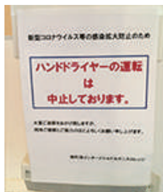
ハンドドライヤーの使用を禁止