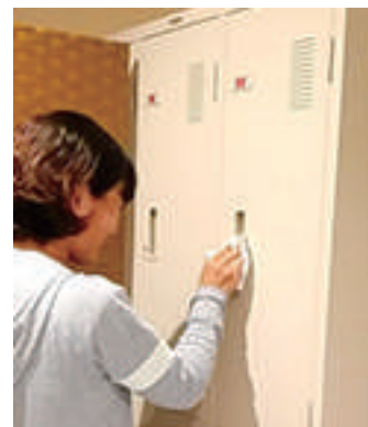
ロッカーの除菌清掃