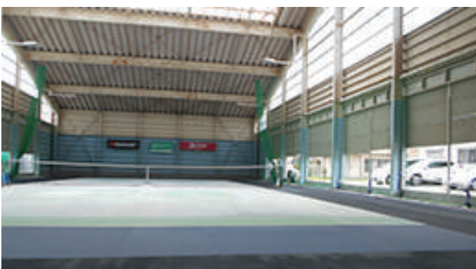
インドアコートは両サイドを開放し換気を十分行って使用