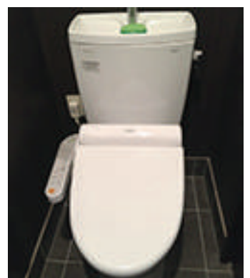
トイレの蓋を閉じ流してください