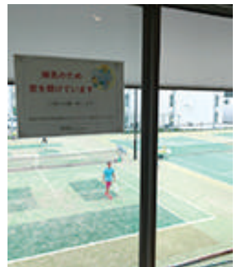
普段よりも長い時間換気