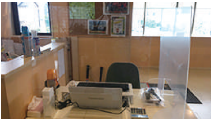
飛沫の飛散を防ぐためにビニールカーテン