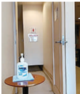
入室の際は手指消毒

※密を避けるため、可能な限り自宅でお着替えをお済ませになって御来校いただくと幸いです。