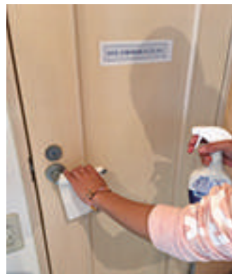
施設内の除菌清掃